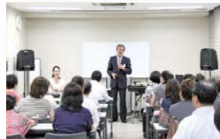
長崎県を元気にしたいと思う人の集まり(長崎元氣塾)